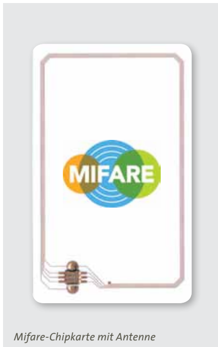
Mifare-Chipkarte mit Antenne