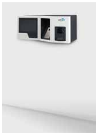
smart.BOOK® Wandmontage Abmaße (HxBxT): 368 x 813 x 335 mm

Individuell und kompatibel mit Ihrem bestehenden System