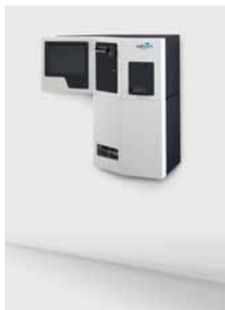
smart.BOOK® für Barzahlung Wandmontage Abmaße (HxBxT): 832 x 813 x 335 mm