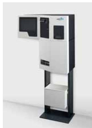
smart.BOOK® für Barzahlung auf Stativ mit Papierkorb