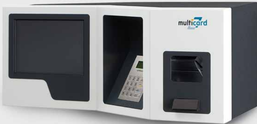
smart.BOOK® Automat für Karte mit Barcode zum Bezahlen mit girocard